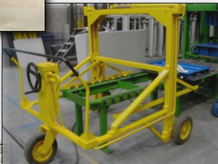
CARRO MANUAL PARA 3 BANDEJAS