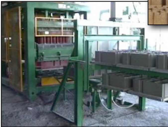
ASCENSOR NEUMATICO 6 BANDEJAS.