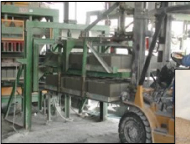
ACOPLAMIENTO PARA CARRETILLA ELEVA-DORA