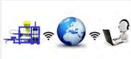
Soporte técnico Online