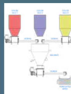
Dosificador de colores