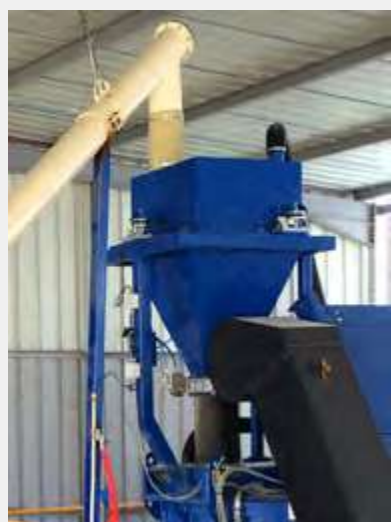
Bascula de cemento