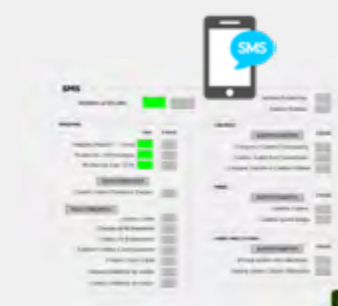
Control de producción