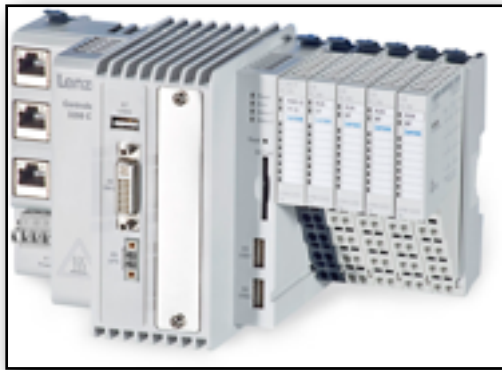
PLC ( Autómata )